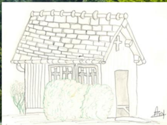
La chapelle du CDJ dessinée par Amy, 13 ans, lors du camp préados 'voile vélo créatif'